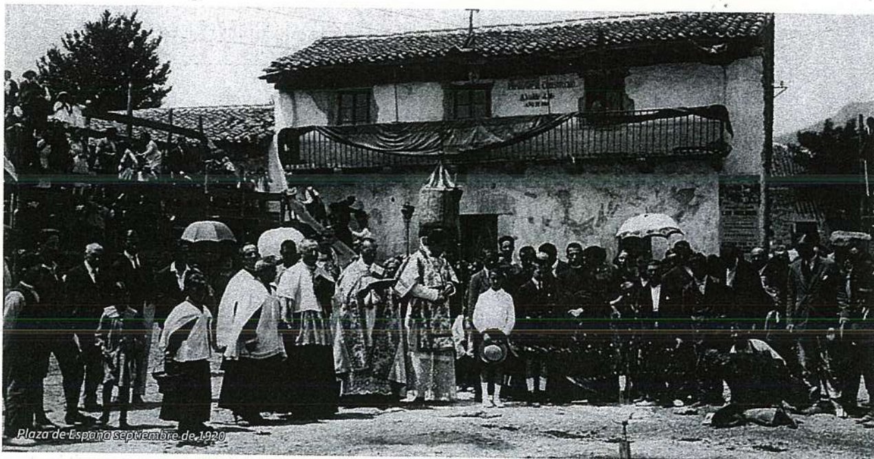
Plaza de España septiembre de 1920