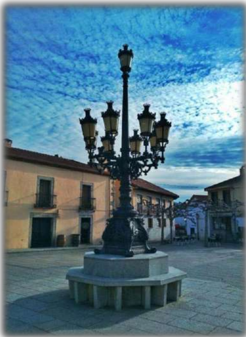
Luminaria en la plaza de España (finales del siglo XX)

En el siglo XII se produjo el asentamiento estable de Los Molinos, siendo sus pobladores en su mayoría ganaderos. Formó parte del territorio llamado El Real de Manzanares hasta que, en el año 1667, la regente Mariana de Austria le concedió el título de Villazgo.