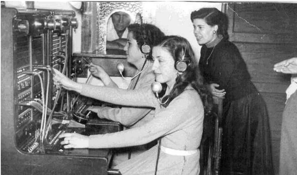
Centralita en la Calle Calvario 1954

Los teléfonos públicos estaban en la calle Calvario, una centralita donde pasaban las llamadas de casa a casa y unas cabinas de madera para conectar con cualquier número. Durante años, la parada del Bus del actual Hiber se llamaba “de teléfonos” Después el locutorio pasó a la calle Palomar, hasta que fue sustituido por cabinas telefónicas en las calles.